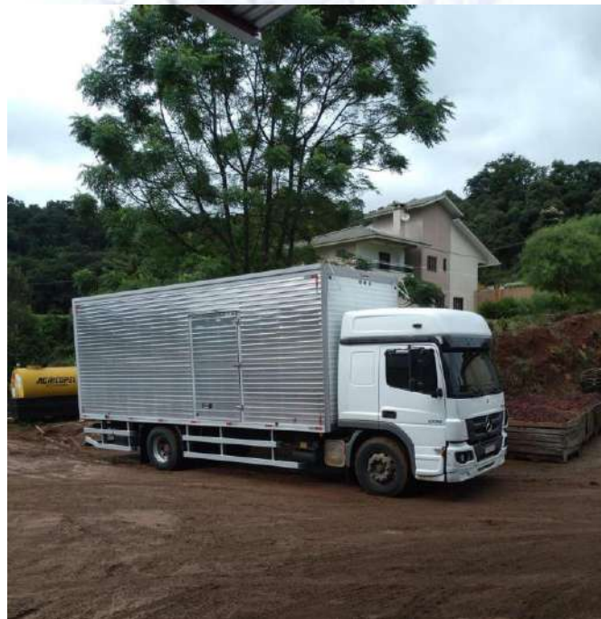
Caminhão Placa RYF8D10