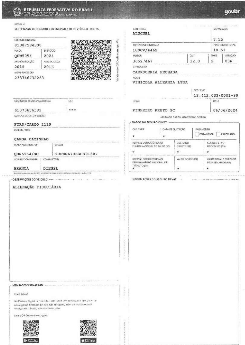
Documento Caminhão Placa-QHW-5954