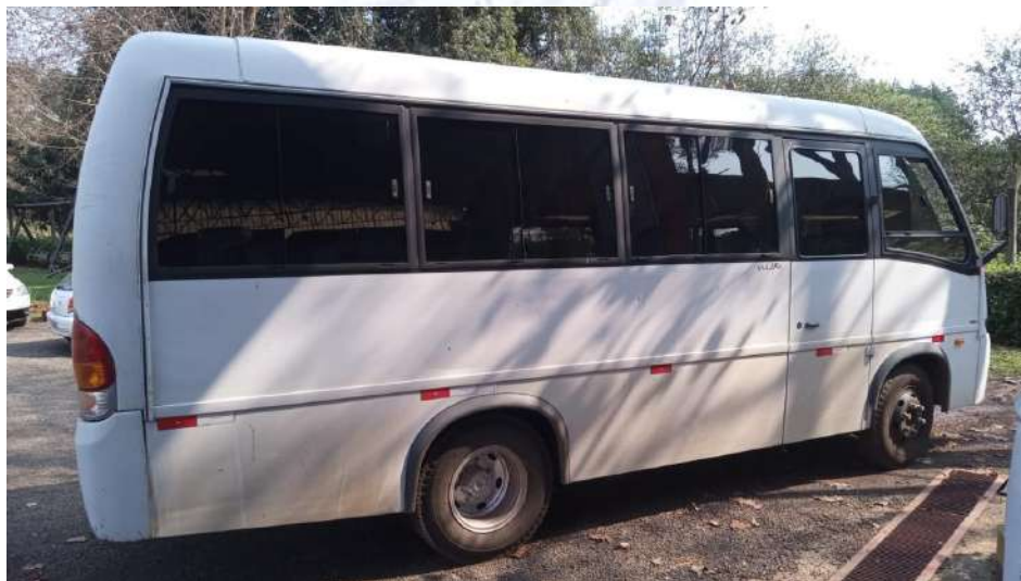
Ônibus Placa MBX9121