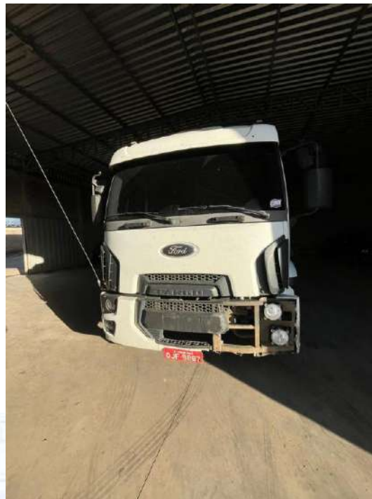
Caminhão Placa QJF-9887