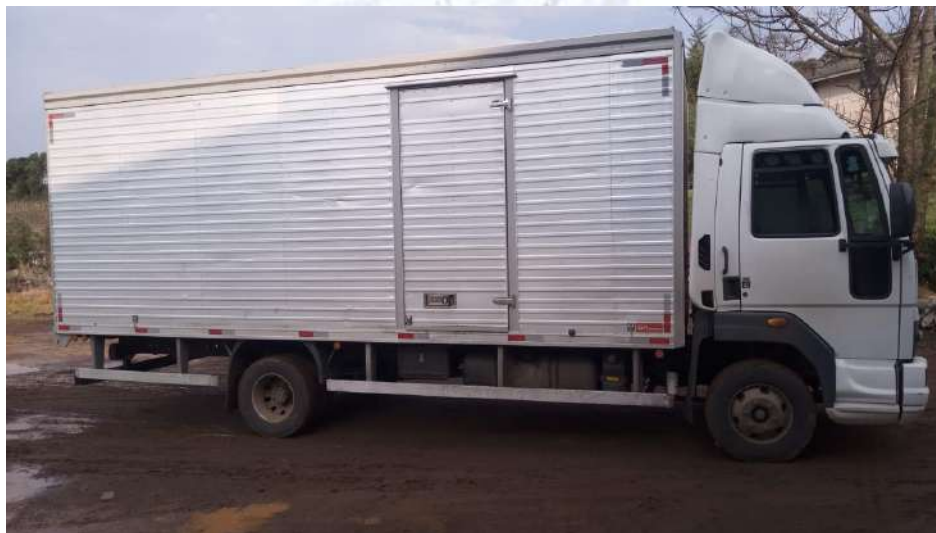
Caminhão Placa QHW-5954