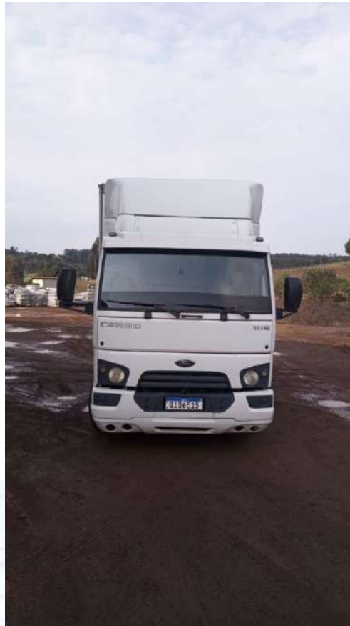
Caminhão Placa QID6E15