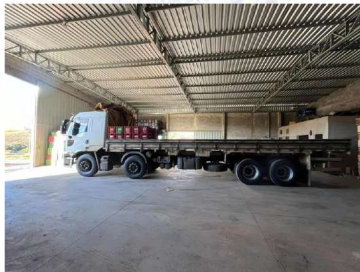
Caminhão Placa QJF-9887