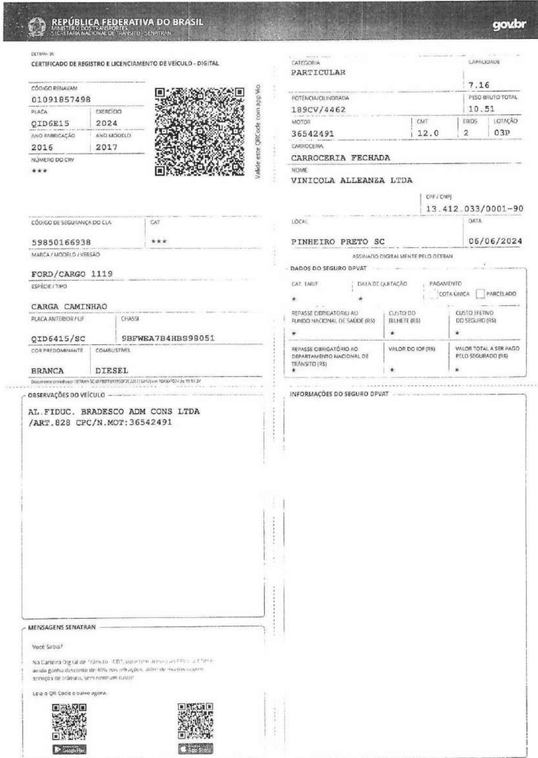
Documento Caminhão Placa-QID6E15