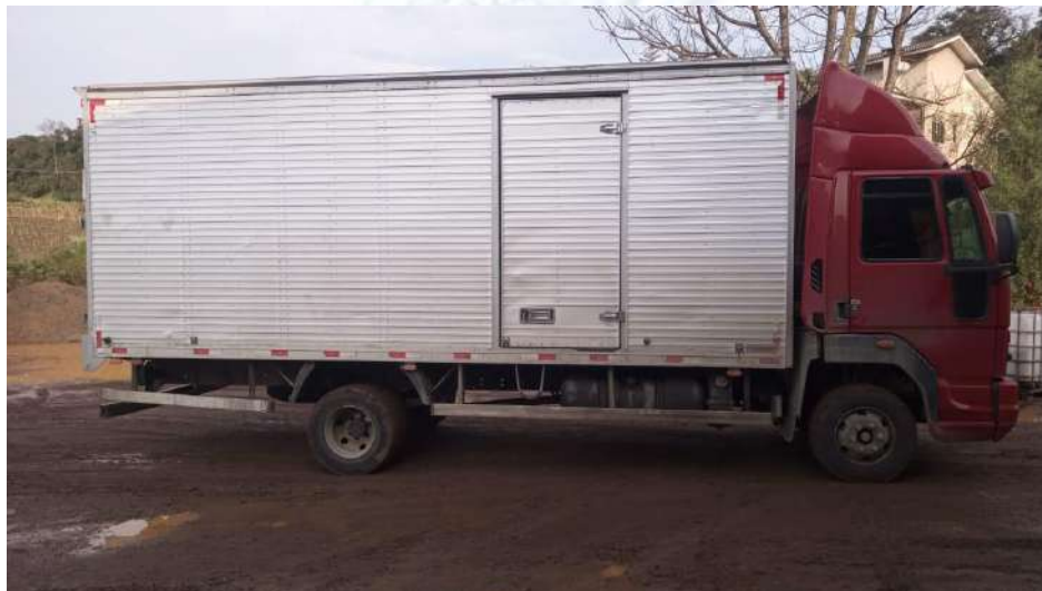
Caminhão Placa QIP-1235