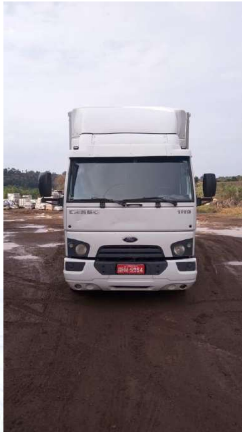
Caminhão Placa QHW-5954