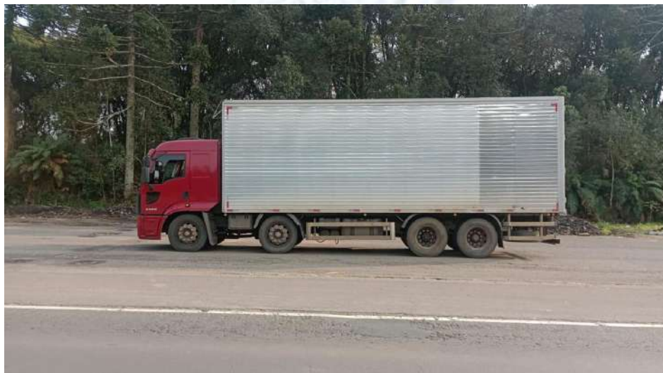
Caminhão Placa MML4B79