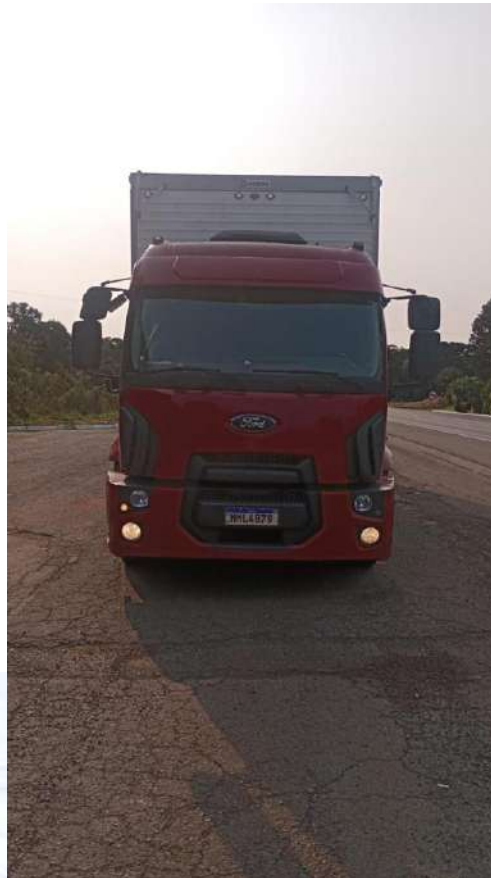
Caminhão Placa MML4B79