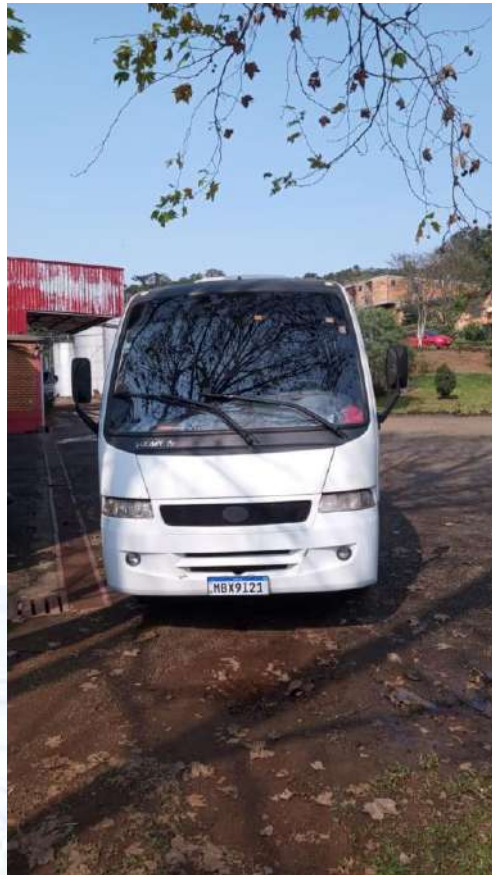
Ônibus Placa MBX9121