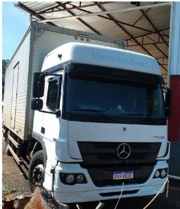
Caminhão Placa RYF8D10