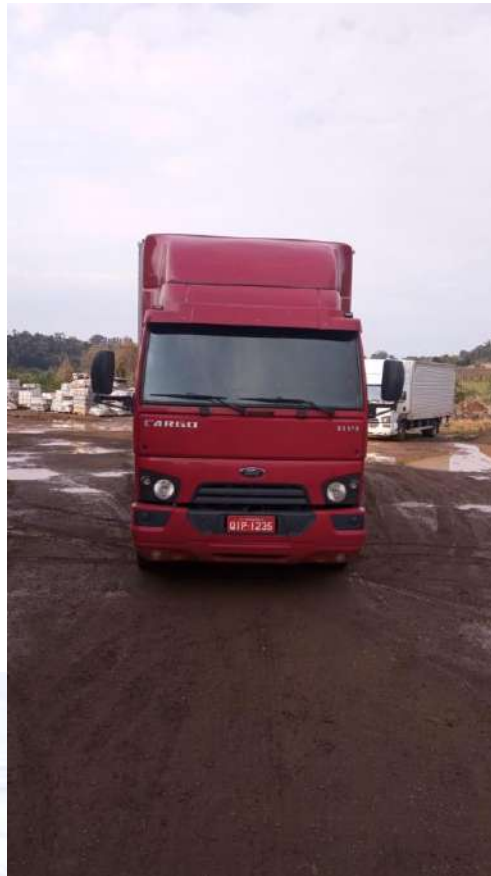
Caminhão Placa QIP-1235