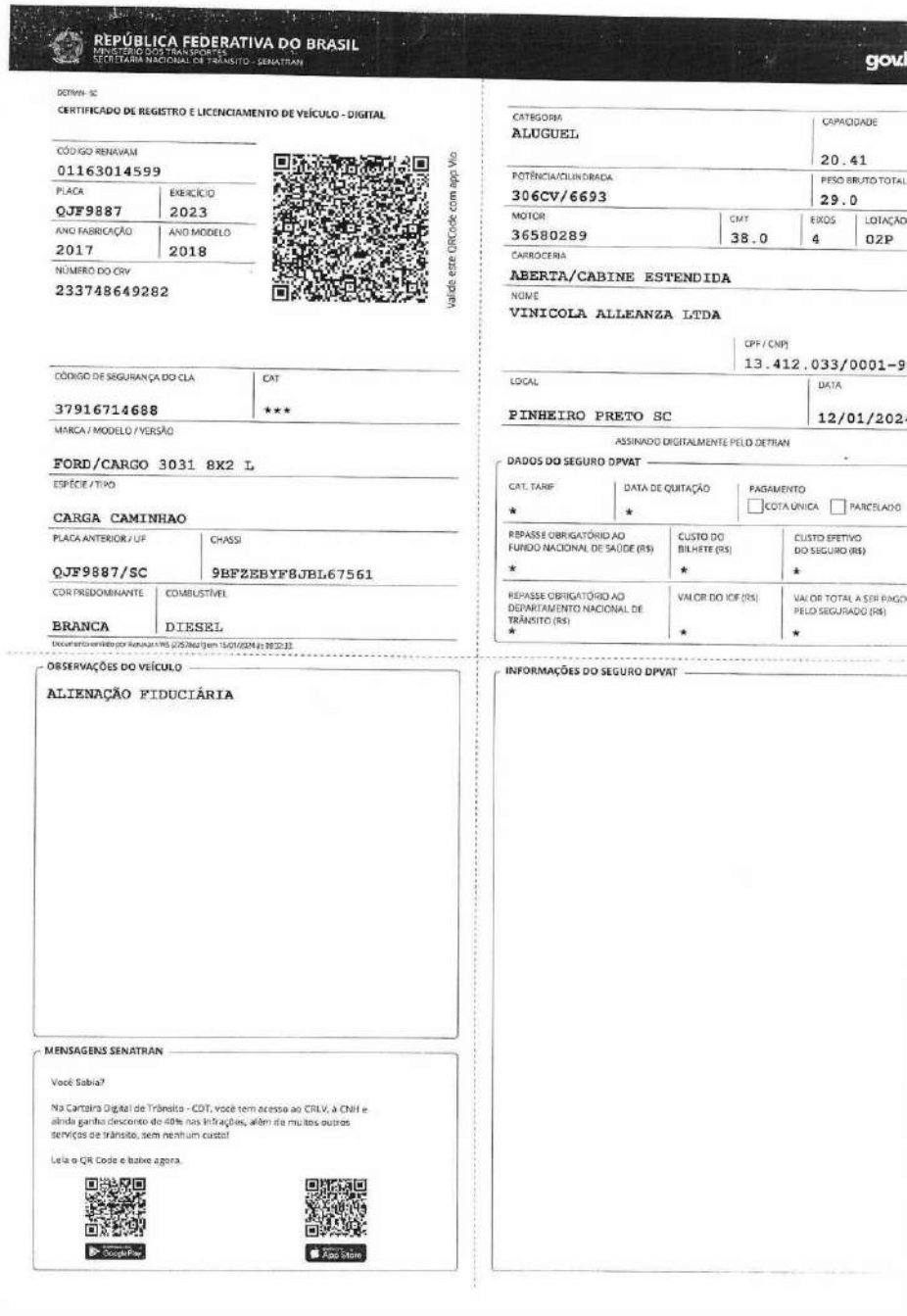
Documento Caminhão Placa-QJF-9887