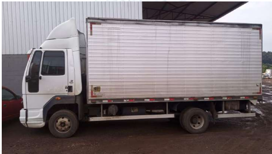
Caminhão Placa QID6E15