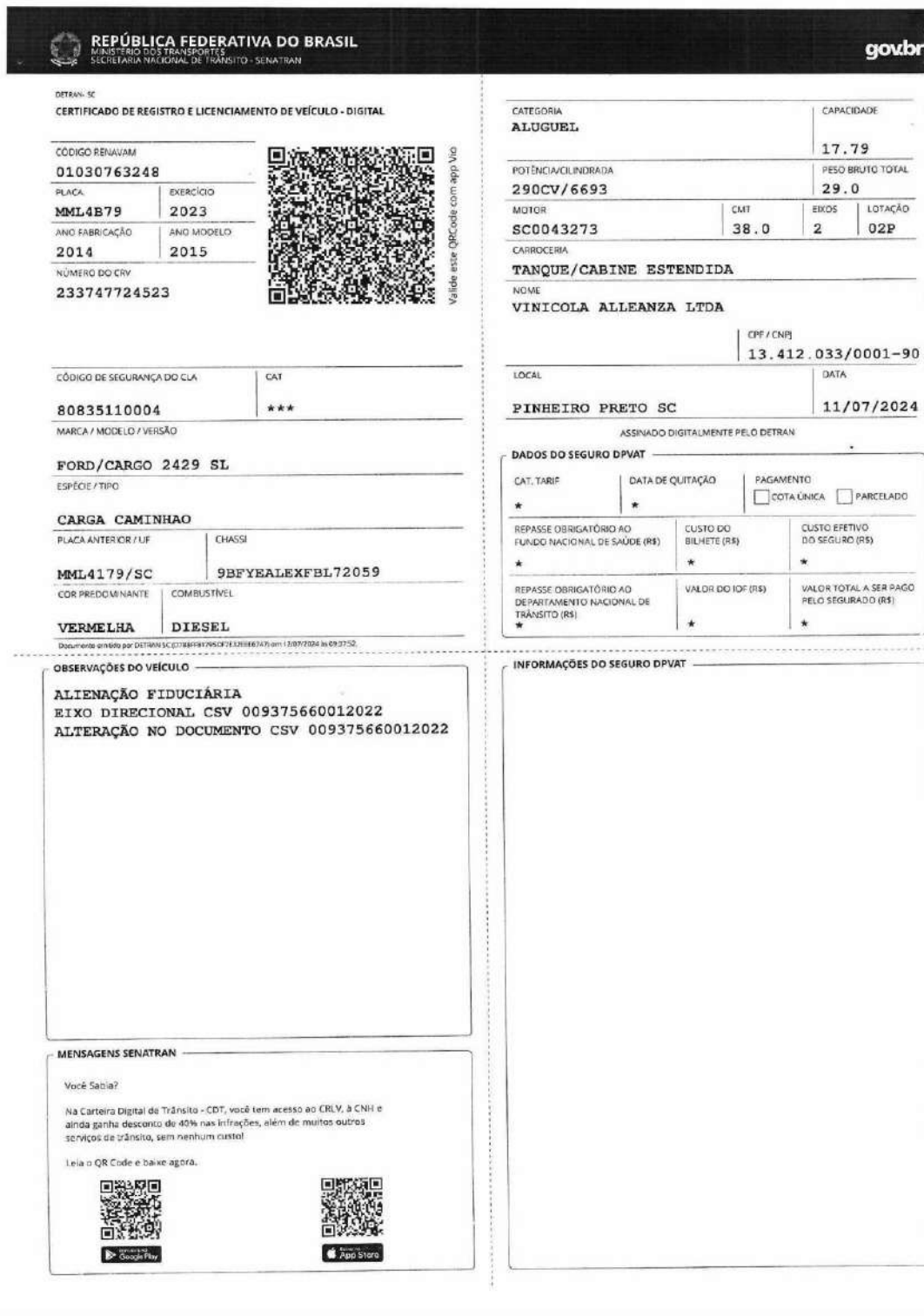
Documento Caminhão Placa-MML4B79